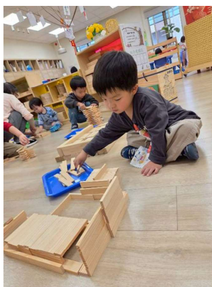
幾何積木建構:邏輯幾何概念