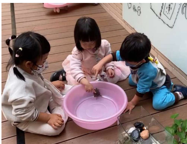
生命教育：愛護動植物與照顧~飼養烏龜