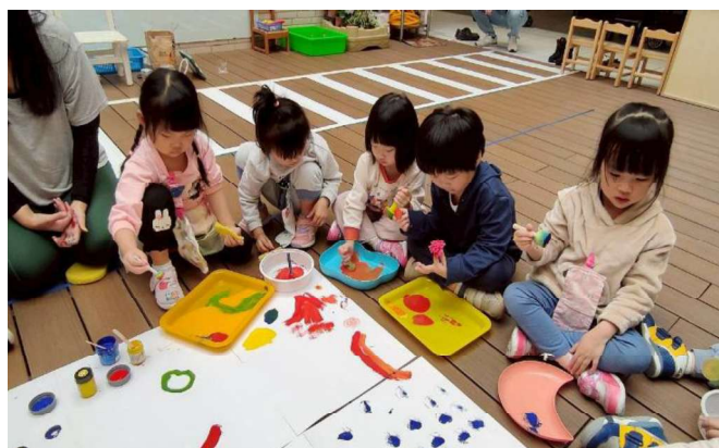
藝術彩繪:合作學習~創藝畫