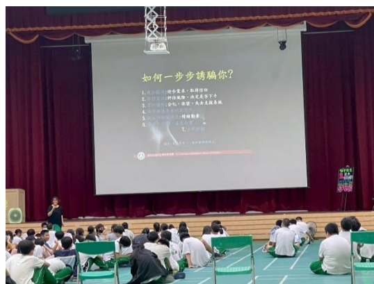
兒少面臨的危險有哪些?如何辨識?