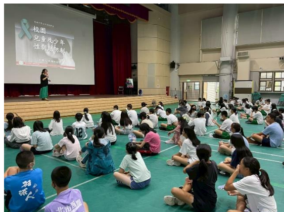
講師先以宣導標題和學生互動