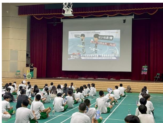
兒少性剝削條例罰則