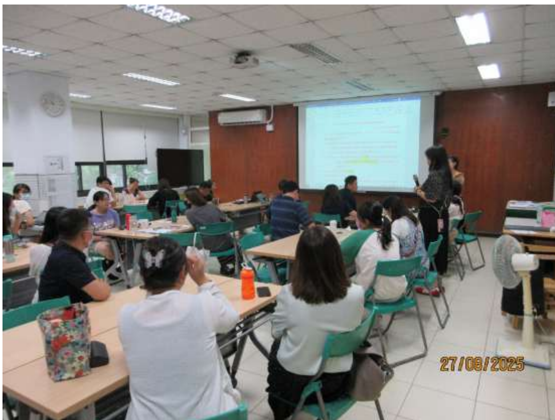
三項(提案 2-4 案)審議事項(學務處報告)