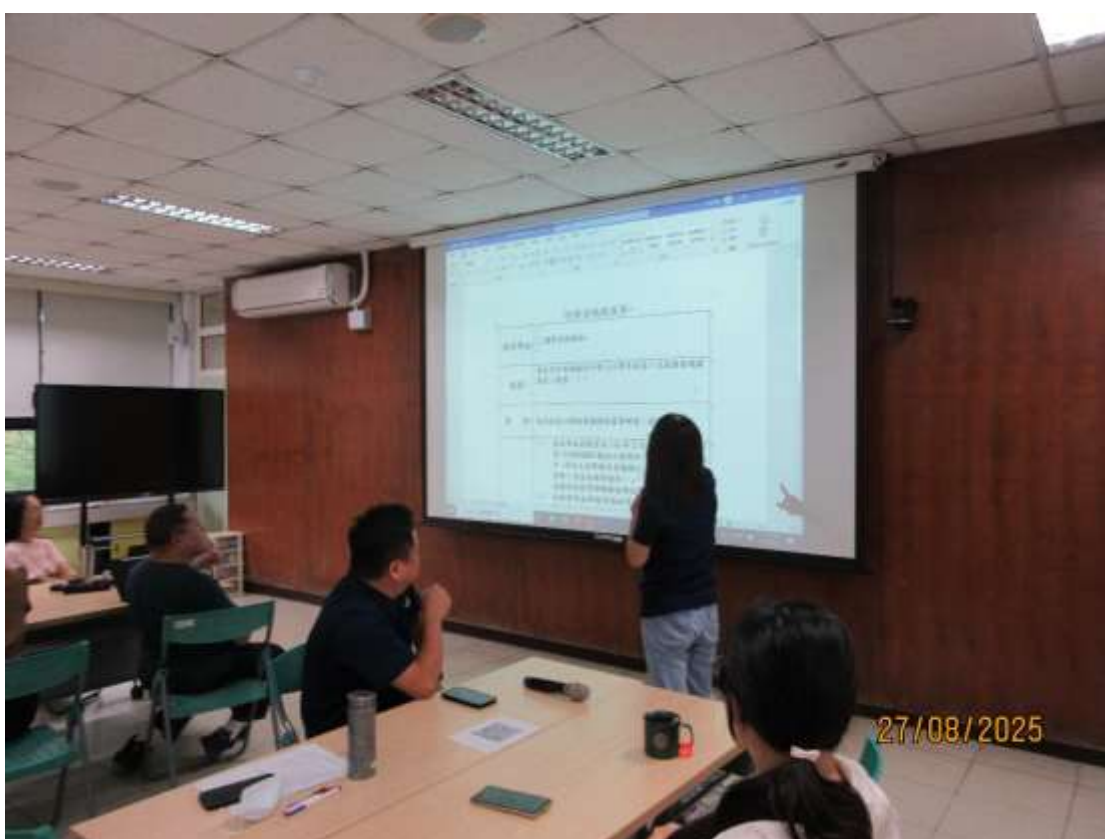
一項(提案 5)審議事項(輔導室報告)