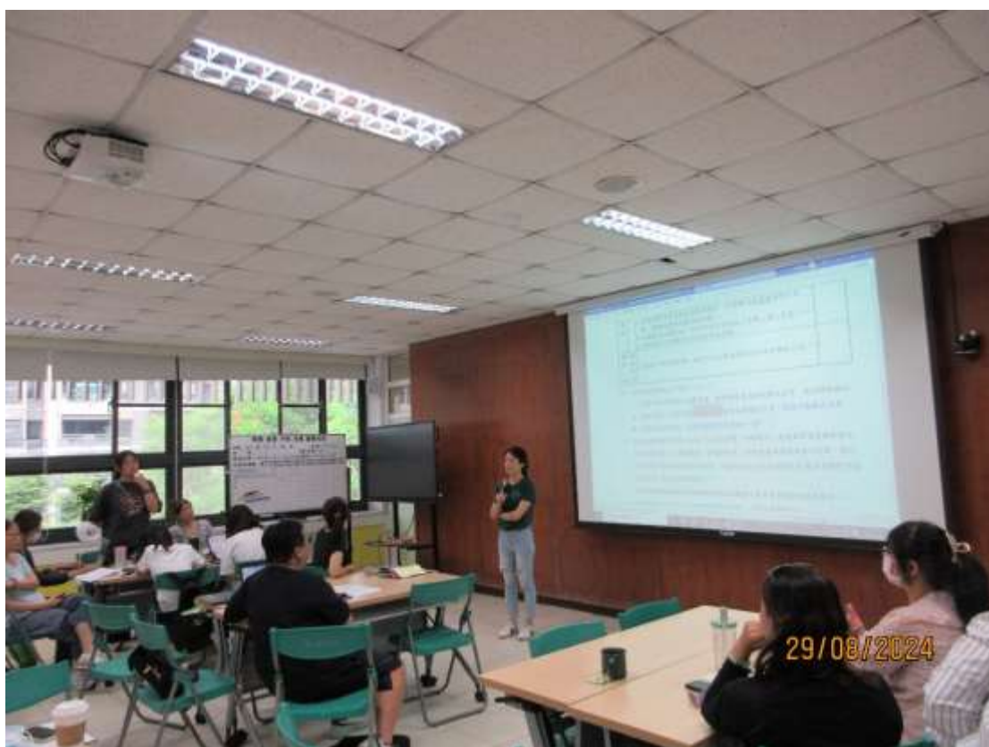
一項(3 案)審議事項(輔導室報告)