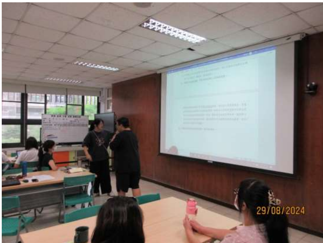
三項(共 4 案)審議事項(文建主任代學務處報告)