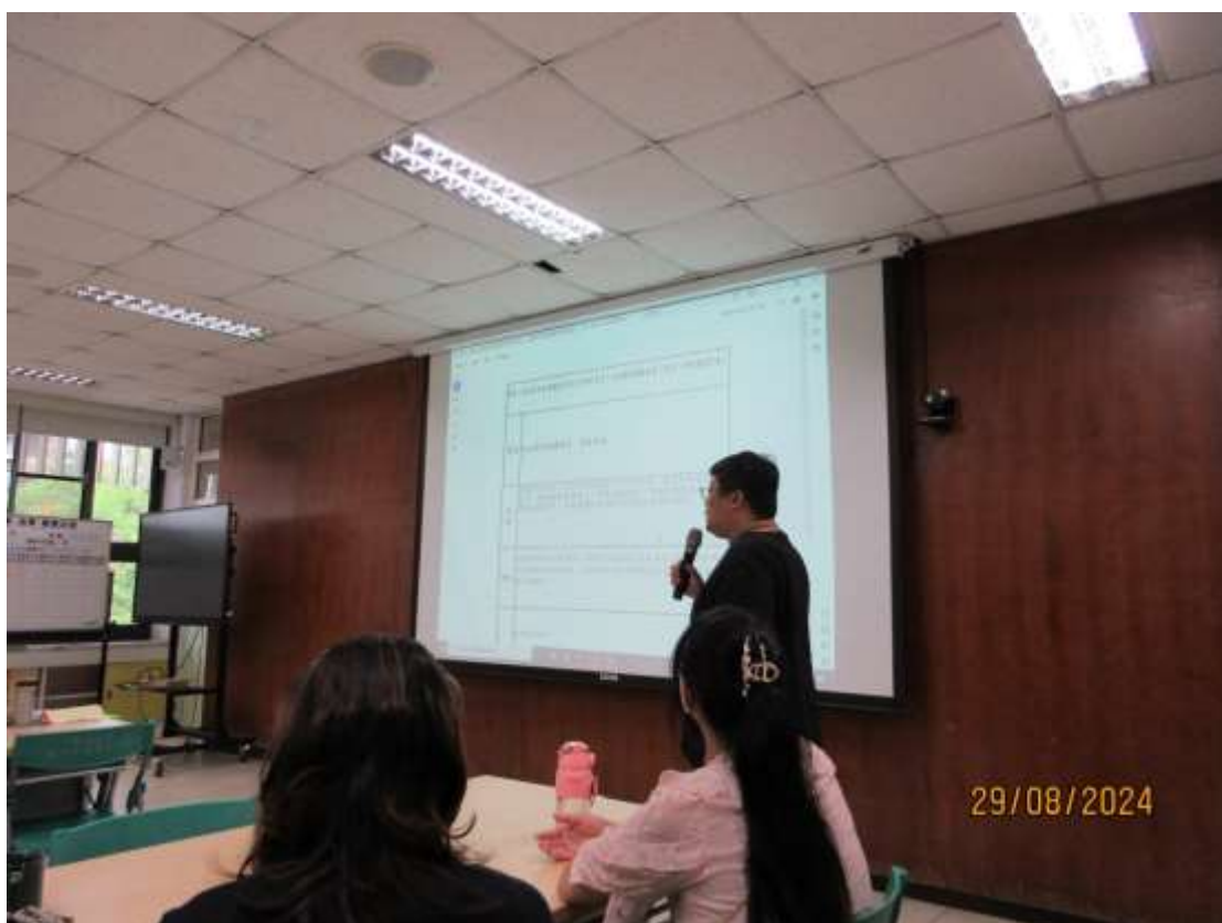
三項(共 4 案)審議事項(文建主任代學務處報告)