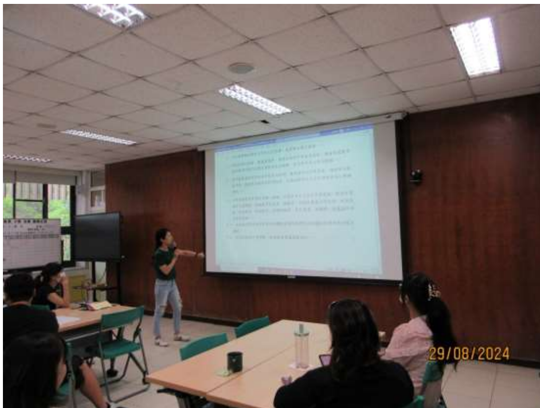
一項(3 案)審議事項(輔導室報告)