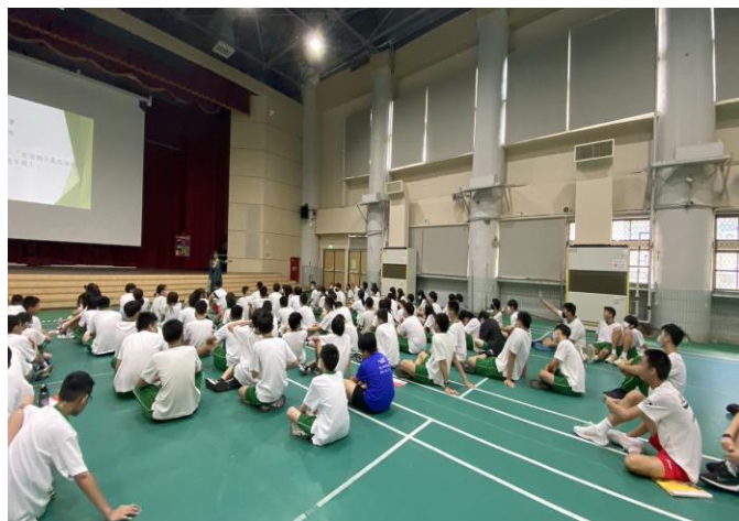
小故事舉例，同學判斷並踴躍發言