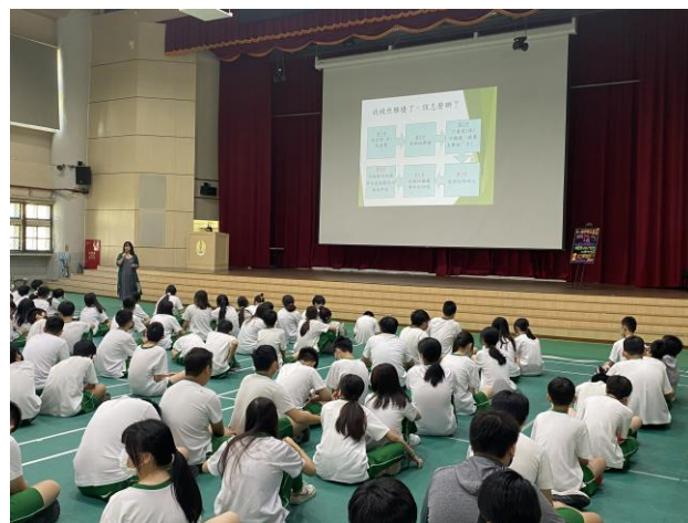
面對性騷擾，可以怎麼做？