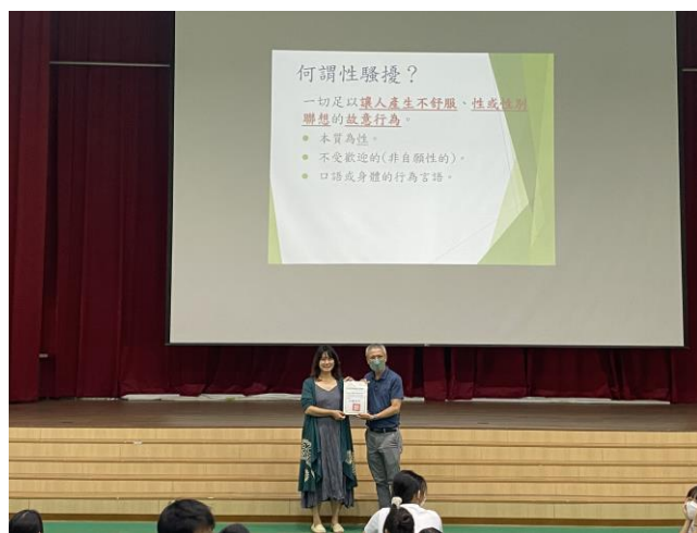
校長結語頒發感謝狀